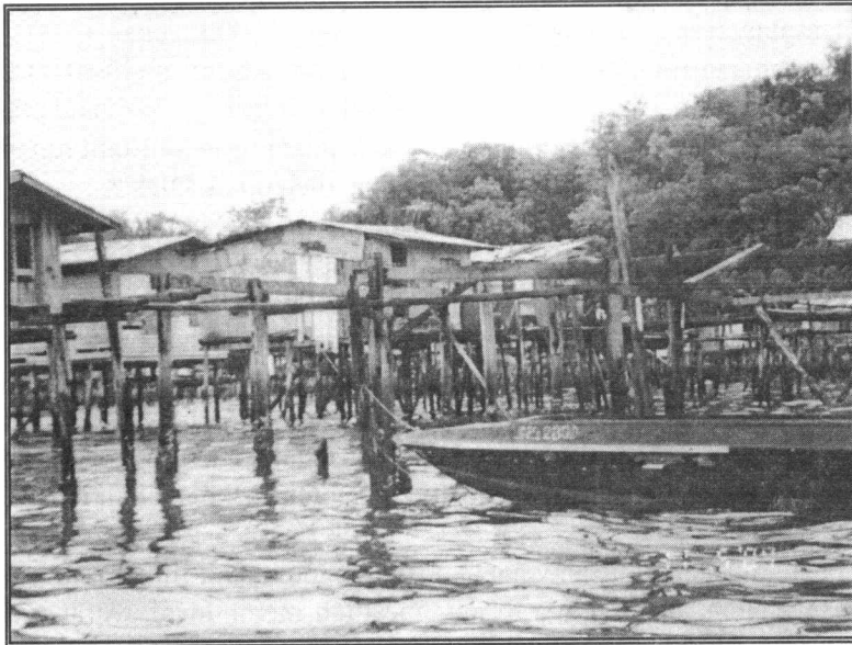
Gambar 1.1: Menunjukkan Bekas Rumah-rumah Yang Telah Dirobohkan Di Kampung Air Pondo