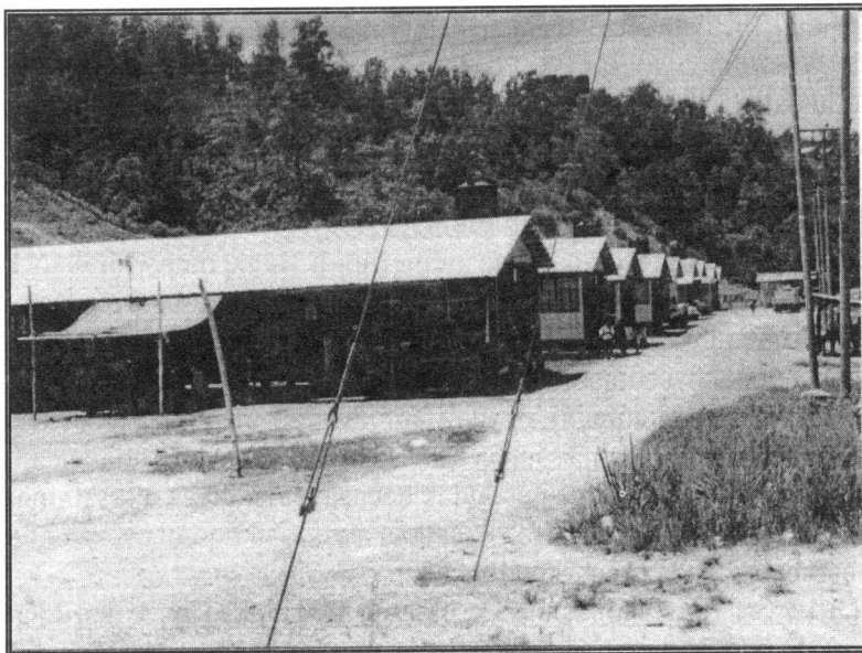
Gambar 1.2: Menunjukkan Penempatan Semula Rumah Panjang Pemandang Filipina Di Telipok

Pada dasarnya, penduduk Pulau Gaya yang dipindahkan ke skim penempatan semula rumah panjang di Telipok ini mestilah mempunyai kewarganegaraan Malaysia atau telah mendapat taraf penduduk tetap. Penduduk yang layak dan ingin berpindah melalui skim ini perlu membuat permohonan terlebih dahulu ke bahagian Unit Penempatan, Jabatan Ketua Menteri. Pada tahun 2003, unit ini telah memindahkan sebanyak 51 buah keluarga yang merupakan penduduk setinggan Kampung Air Pondo, Kampung Air Lok Urai dan Kampung Lok Baru ke kawasan penempatan semula rumah panjang di Telipok. 26 Mereka yang dipindahkan ini sebilangan besarnya adalah keluarga yang hilang tempat tinggal apabila rumah mereka dirobuhkan sepanjang operasi pembongkaran dilakukan pada tahun 2002.