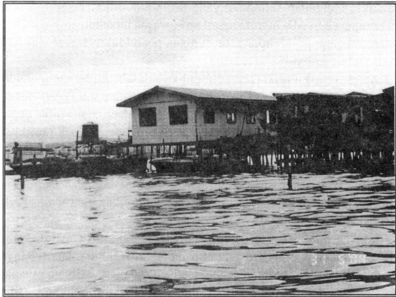
Gambar 1.0: Menunjukkan Salah Sebuah Rumah Pendatang Filipina Di Kampung Air Pondo, Pulau Gaya

Usaha pembongkaran dan pemindahan setinggan di kawasan Pulau Gaya telah pun menarik perhatian kerajaan pusat dan kerajaan negeri. 18 Bagi tujuan melancarkan lagi usaha membongkar petempatan setinggan khususnya di kampung-kampung air satu Jawatankuasa Khas telah pun ditubuhkan. Jawatankuasa ini bertanggung jawab untuk mengeluarkan arahan dari semasa ke semasa kepada bahagian penguatkuasaan bagi melakukan sebarang tindakan pembongkaran. 19